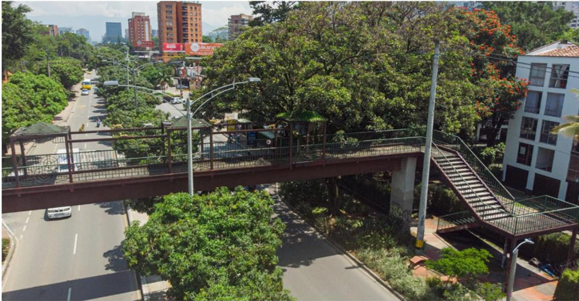
Antiguo puente peatonal del INEM – Alcaldía de Medellín

En las ciudades los puentes peatonales benefician a los vehículos y no a las personas, es por esto que Medellín busca desmontar más infraestructuras de este tipo. La ciudad tomó un nuevo rumbo en la planificación urbana desde que en el 2014 el Concejo de Medellín aprobó un nuevo Plan de Ordenamiento Territorial.